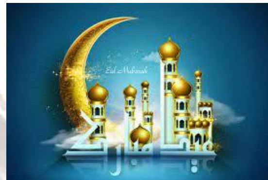
Ураза-Байрам (Свято розговіння. Іслам)