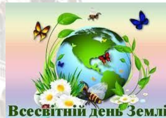
Всесвітній день Землі