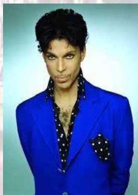
Музикант, виконавець ритм-енд-блюзу Прінс (Прінс Нельсон). Занесений до Залу слави рок-н-ролу. Кількаразовий володар „Греммі“. Володар „Оскара“ 1984 р. за пісню «Purple Rain» — найкращу пісню до фільму (США, 1958-2016)