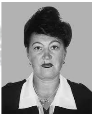
Невропатолог, професор Наталія Грицай (1953)