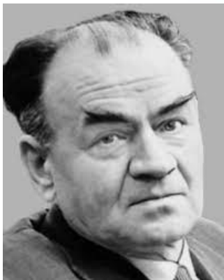
Письменник Іван Багмут (1903-1975)