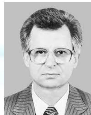
Патофізіолог, професор Григорій Кривобок (1943)