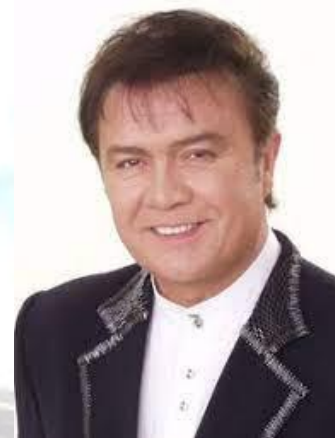
Естрадний співак Віталій Білоножко (1953)