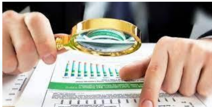
День працівника служби контролю за регульованими цінами (Україна)