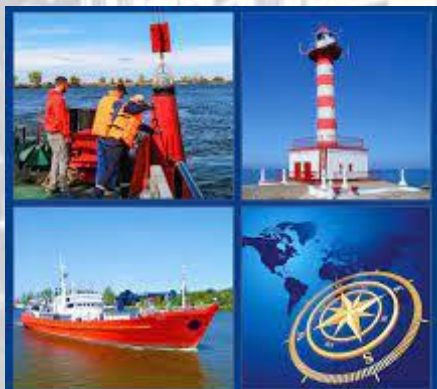
21 ЧЕРВНЯ ВСЕСВІТНІЙ ДЕНЬ ГІДРОГРАФІЇ