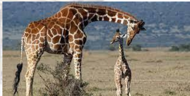
Всесвітній день жирафа