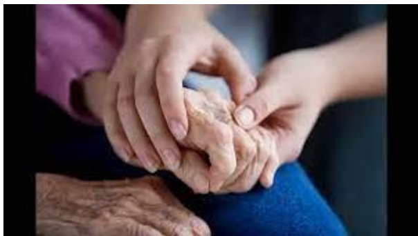
Всесвітній день гуманізму