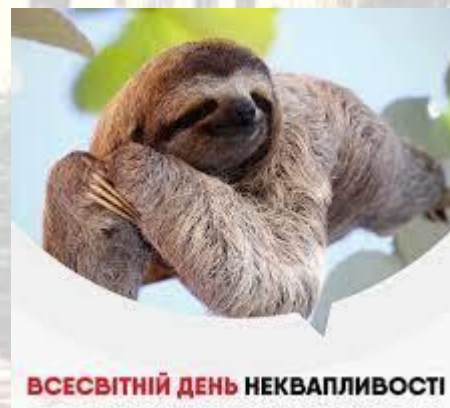
ВСЕСВІТНІЙ ДЕНЬ НЕКВАПЛИВОСТІ