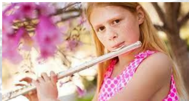
Всесвітній день музики (або Міжнародний день домашньої музики)