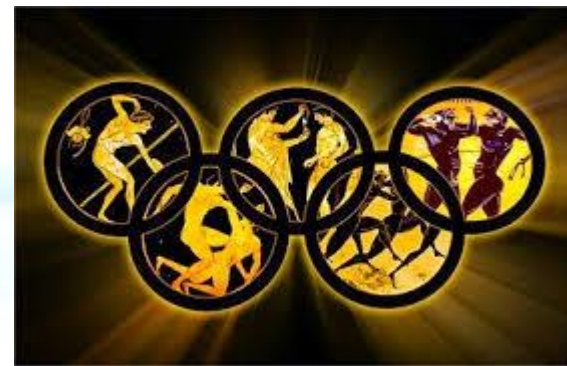
Міжнародний олімпійський день