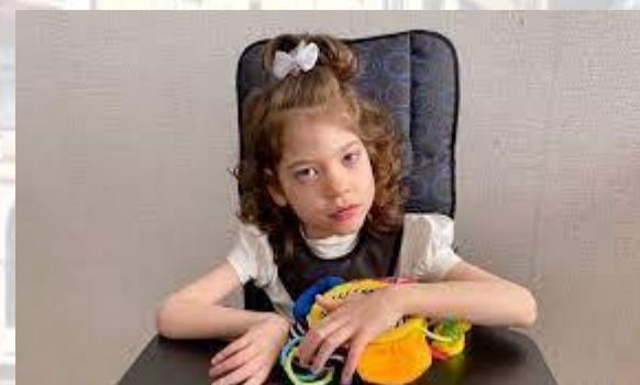
Міжнародний день поширення інформації про синдром Драве