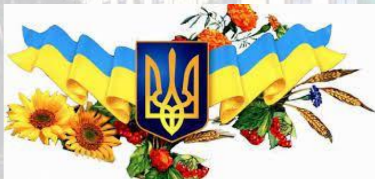
День державної служби України