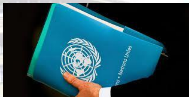
День державної служби ООН