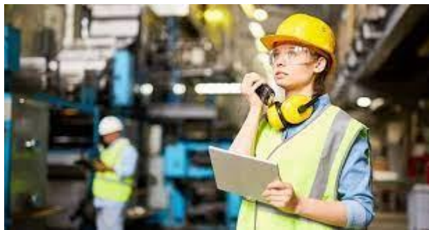
Міжнародний день жінок в інженерії