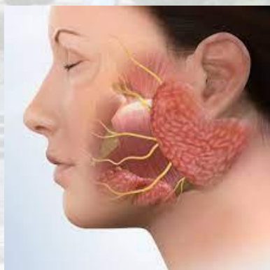
День синдрому Шегрена