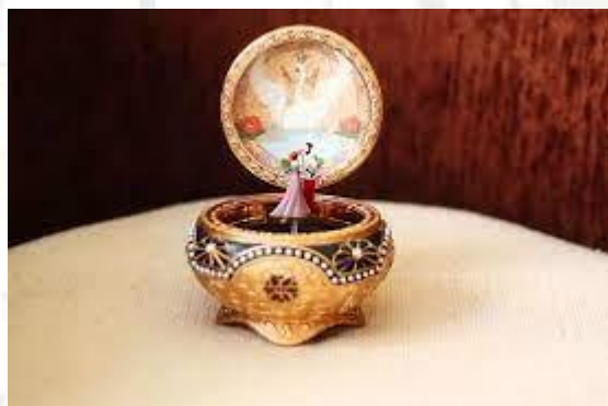
День музичних скриньок