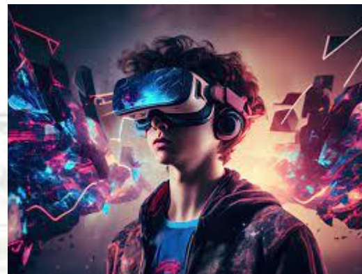
День віртуальних світів