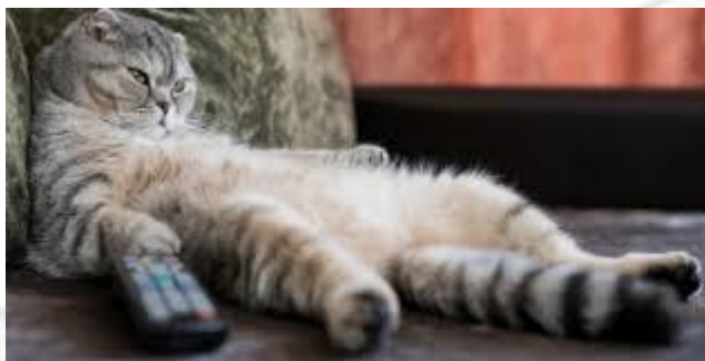
Всесвітній день лінощів