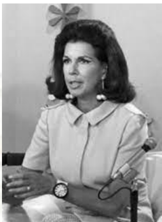
Письменниця, авторка «жіночих» бестселлерів Жаклін С'юзен (США, 1918-1974)