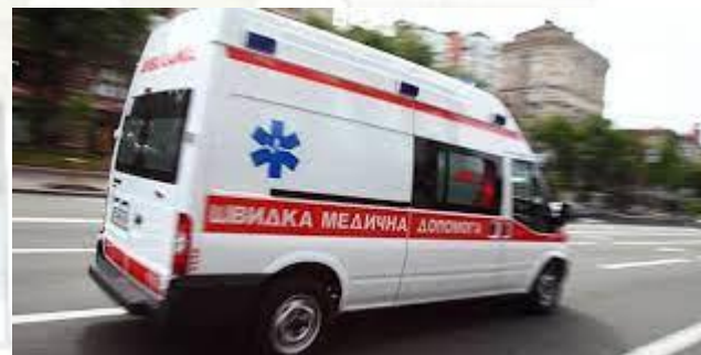
Міжнародний день медичного транспорту