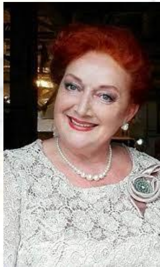
Актриса театру та кіно Любов Тимошевська (1958)