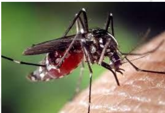
Всесвітній день москітів (комарів)