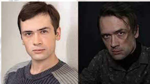
Актор театру та кіно Анатолій Пашинін (1978)