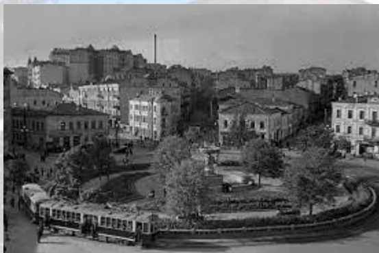
У Харкові відбувся V всеукраїнський з'їзд хірургів (1933)