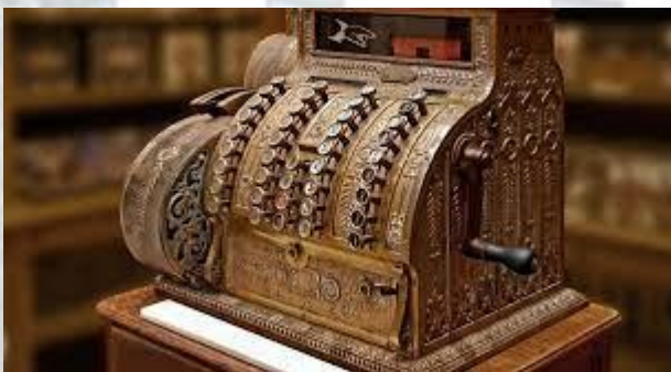
День народження касового апарату