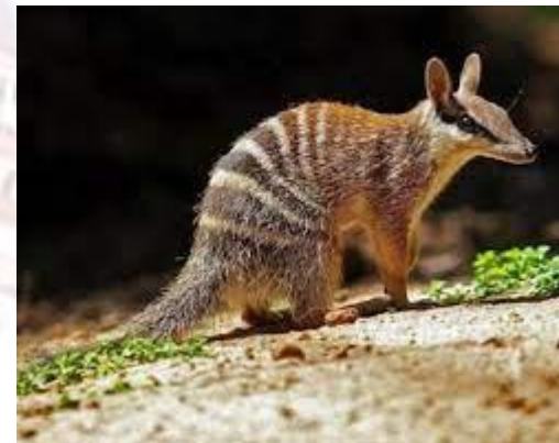
День сумчастого мурахоїда або День намбата