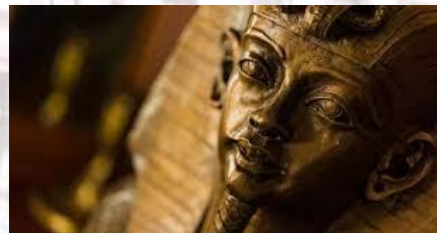
День царя Тутанхамона