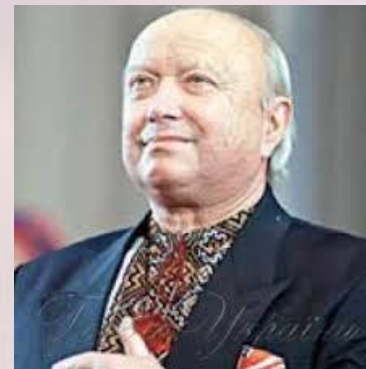
Хореограф, Герой України 2004 року Мирослав Вантух (1939)