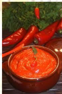
День гострого соусу