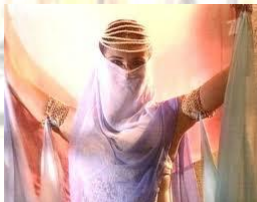
День танцю «Семи вуалей»