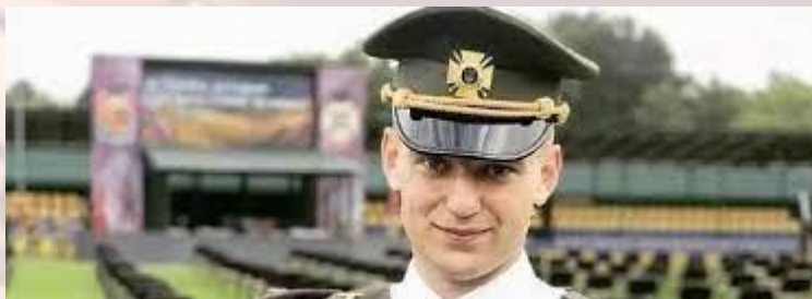
Військовик, Герой України 2022 року Євген Пальченко (1999)