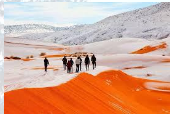
Вперше за багато років у пустелі Сахара випав сніг (1979)