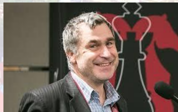
Шахіст, Чемпіон Європи 2004 року. Чемпіон світу з блицу 2007 року. Чемпіон світу зі швидких шахів 2016 року. Триразовий переможець супертурніру в Лінарес Василь Іванчук (1969)