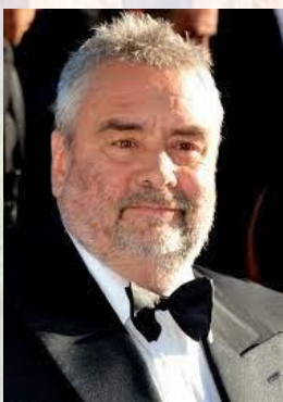
Кінорежисер, сценарист і кінопродюсер Люк Бессон (Франція, 1959)