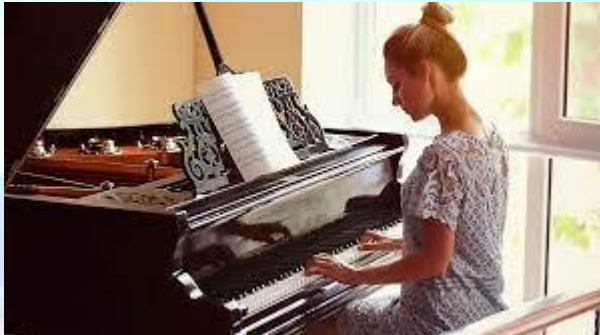
Всесвітній день фортепіано