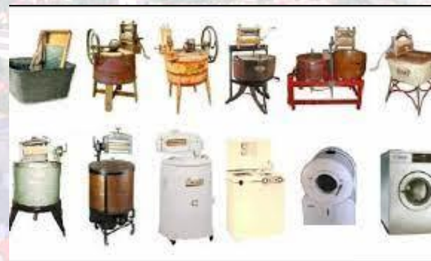
День народження пральної машини