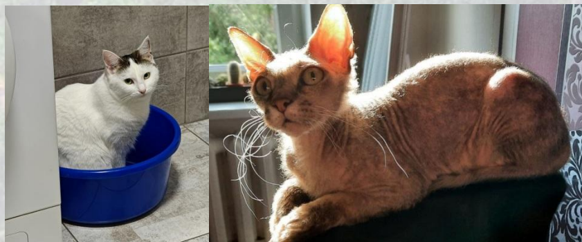
День поваги до кішки