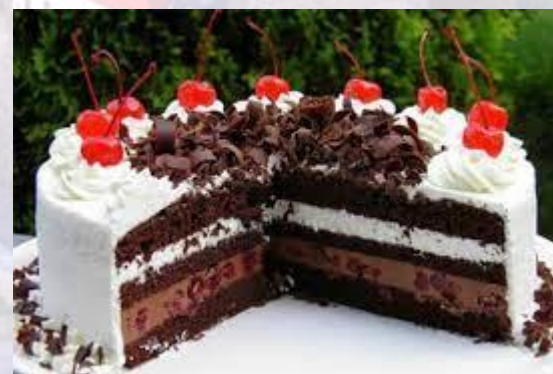
День торта «Чорний ліс»