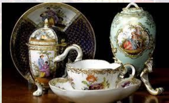
День народження саксонського фарфору