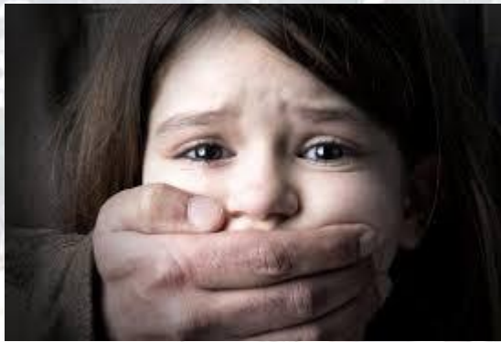
Всесвітній день боротьби з сексуальним насильством над дітьми