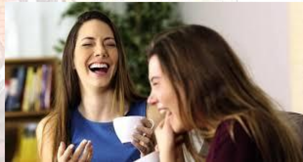
Міжнародний день раптового сміху