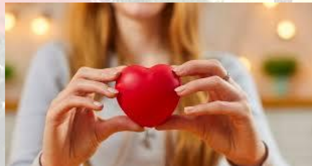
День добрих справ