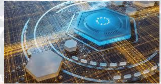
Всесвітній квантовий день