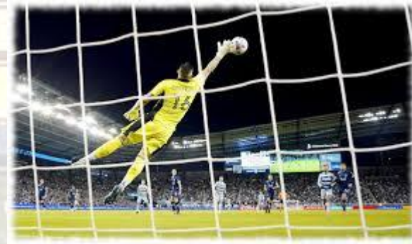
Міжнародний день воротаря