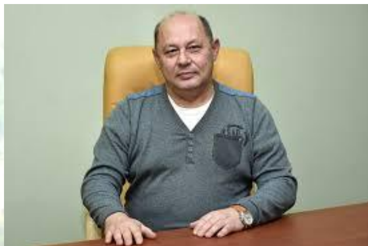
Хірург, професор Володимир П'ятночка (1964)