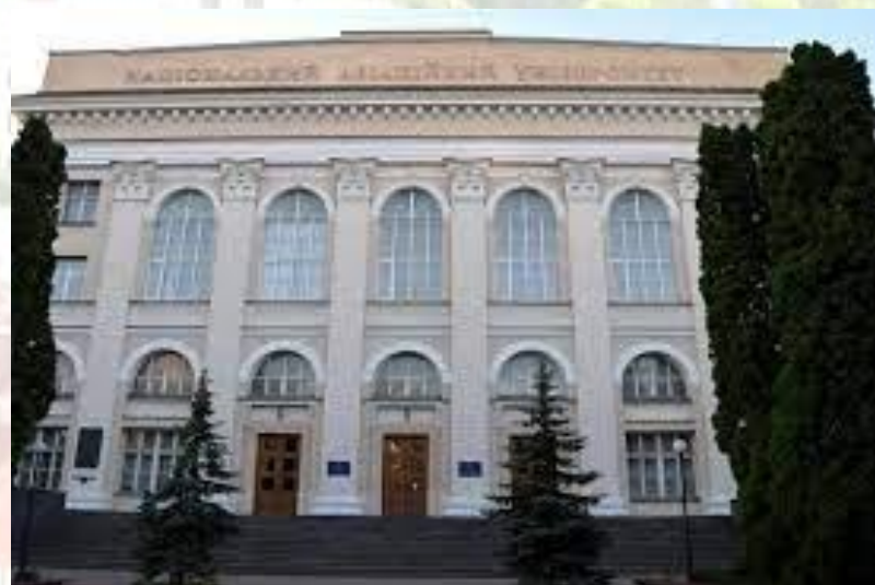
На базі Національного авіаційного університету створено Інститут Аеронавігації (2009)