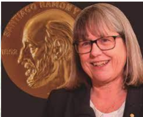
Фізик, Нобелівський лауреат 2018 року Донна Стрікленд (Канада, 1959)