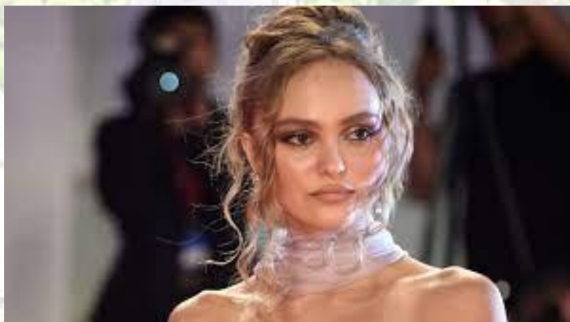
Актриса, модель, дочка Джонні Деппа та Ванесси Параді Лілі-Роуз Мелоді Депп (Франція, 1999)